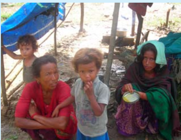
सन् २००७ को सुदूर पश्चिमस्थित बाढीपीडित उद्धार शिविरको एक भलक

जानकारीले परियोजना कार्यलाई प्रष्ट र अरुलाई सिक्न तथा त्यसलाई पुनः प्रयोग गर्न सहयोग पुऱ्यायो। प्रकोप व्यवस्थापनलाई पन्छाउन चाहने विद्यमान अभ्यासमा परिवर्तन ल्याउने साभ्ना उद्देश्यको निमित्त स्थानीय सरकारले स्रोतमा साभेदारीको थालनी गरेको छ।