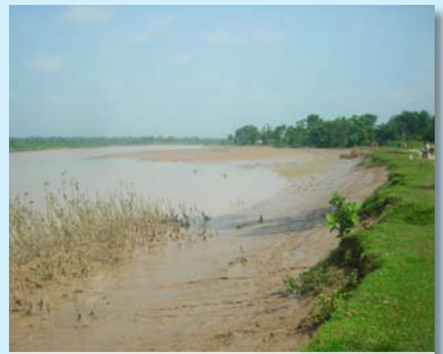
बाढीग्रस्त पश्चिमी तराई