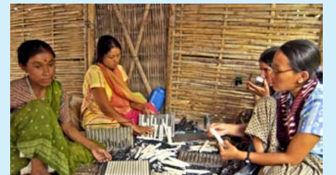
भुटानी शरणार्थी महिलाहरू मैन बनाउँदै

लु.वि.फे. नेपालका साभेदार संस्थाहरू सारथी र सोभा समूहहरूले एचआईभी तथा एड्ससम्बन्धी सन्देश प्रवाहित गर्न र सर्वसाधारणलाई एचआईभीको खतराबारे जानकारी दिन र सुरक्षित व्यवहारलाई प्रोत्साहित गर्न अन्तरक्रिया कार्यक्रम आयोजना गरेका थिए।