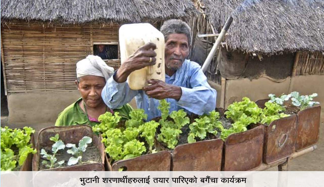
भुटानी शरणार्थीहरूलाई तयार पारिएको बगैँचा कार्यक्रम

लु.वि.फे. नेपालको पूर्वी क्षेत्रीय केन्द्रले यस वर्ष पनि विभिन्न गतिविधिहरू संचालन गरेको छ।